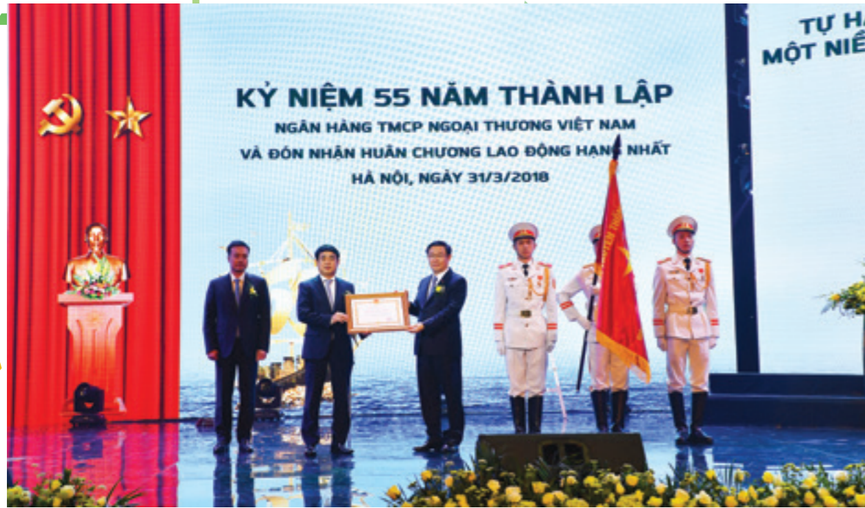
Đ/c Vương Đình Huệ - Ủy viên Bộ Chính trị, Phó Thủ tướng Chính phủ (thứ 3 từ trái sang) thừa ủy quyền của Chủ tịch nước trao Huân chương Lao động hạng Nhất cho Vietcombank