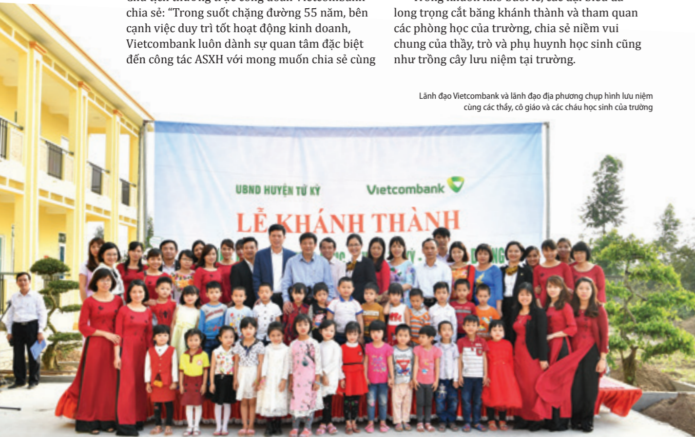
Lãnh đạo Vietcombank và lãnh đạo địa phương chụp hình lưu niệm cùng các thầy, cô giáo và các cháu học sinh của trường

Trong khuôn khổ buổi lễ, các đại biểu đã long trọng cắt băng khánh thành và tham quan các phòng học của trường, chia sẻ niềm vui chung của thầy, trò và phụ huynh học sinh cũng như trồng cây lưu niệm tại trường.