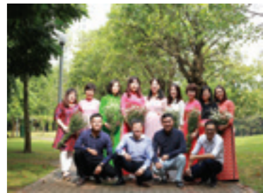
Vietcombank là ngôi nhà thứ hai của tôi