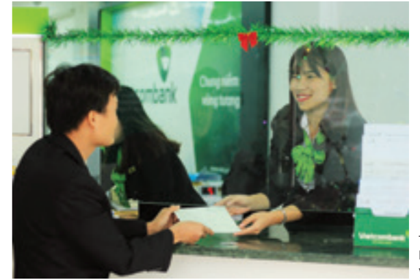
Trong công việc luôn mỉm cười với khách hàng

8 năm qua, Vietcombank luôn là một điều gì đó mà tôi trân trọng, yêu quý. Đây là nơi chúng tôi chia sẻ với nhau thật nhiều cảm xúc, thật nhiều yêu thương.