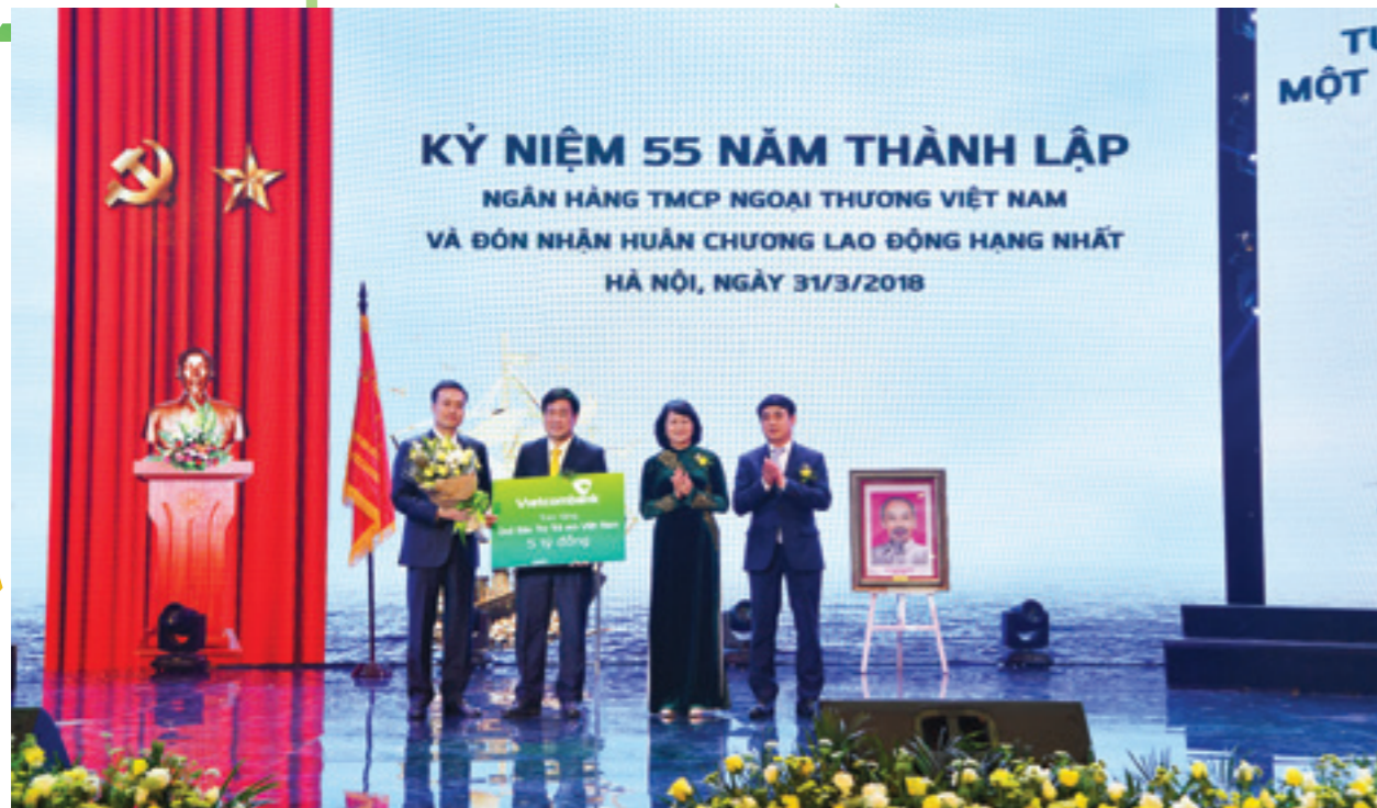
Đại diện Quỹ Bảo trợ trẻ em tặng hoa cảm ơn Ban Lãnh đạo và tập thể CBNV Vietcombank đã hỗ trợ và đồng hành cùng Quỹ trong suốt thời gian qua

Trước năm 1975, trong giai đoạn chiến tranh, Vietcombank vừa thực hiện sứ mệnh đặc biệt là cung ứng ngoại tệ cho chiến trường miền Nam, phục vụ cho cuộc đấu tranh, thống nhất đất nước, vừa đảm đương nhiệm vụ thanh toán quốc tế cho sự nghiệp xây dựng chủ nghĩa xã hội ở miền Bắc. Sau ngày miền Nam giải phóng, bằng nhiều biện pháp tích cực và có hiệu quả, Vietcombank đã nhanh chóng tiếp quản hệ thống ngân hàng của chế độ cũ, đấu tranh với các ngân hàng nước ngoài, thu về cho quốc gia một khối lượng tài sản, vốn ở nước ngoài lên tới hàng trăm triệu đô la Mỹ, góp phần vào công cuộc tái thiết và phát triển kinh tế xã hội của đất nước.