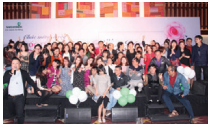
Không khí vui vẻ tại Dạ hội “Đêm huyền diệu” mừng ngày Quốc tế Phụ nữ 8/3

Tối cùng ngày, CN đã tổ chức Gala “Đêm huyền diệu” chào mừng Ngày Quốc tế Phụ nữ 8/3 với chương trình văn nghệ giao lưu đặc sắc.