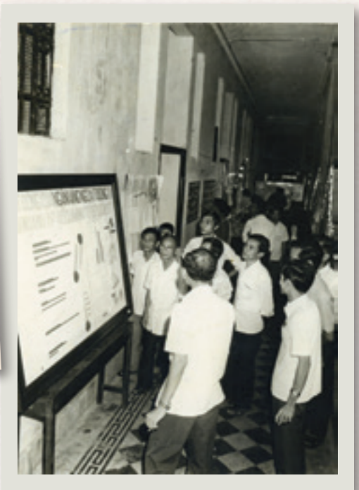
Triển lãm báo tường của các phòng ban NHNT Việt Nam tại Tp. Hồ Chí Minh - 1977

T hực tiễn quá trình xử lý số ngoại tệ của chính quyền Sài Gòn cũ gửi tại các ngân hàng nước ngoài mà Nhà nước Việt Nam Dân chủ cộng hòa có quyền thừa kế song bị chính quyền Mỹ phong tỏa sau chiến tranh không nắm bắt bối cảnh trên.