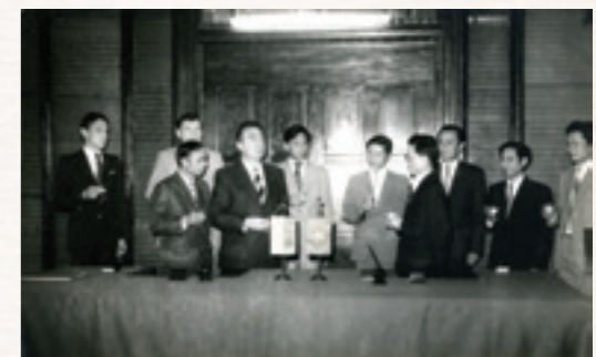
Ký hợp tác với Ba Lan - 1978

Về phương thức quản lý, sau khi hoàn tất các thủ tục pháp lý, NHTM Việt Nam đã giao cho Vietcombank trực tiếp quản lý, điều hành số tài sản lớn trên. Song do chính sách cấm vận của Mỹ đối với Việt Nam, sau cuộc chiến, số tài sản kể trên đã bị chính quyền Mỹ phong tỏa, không cho Việt Nam sử dụng.