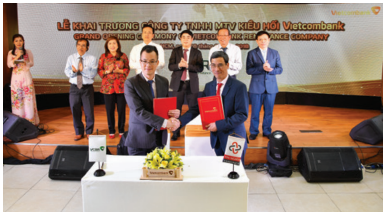
VCBR và TN Monex ký kết thỏa thuận hợp tác