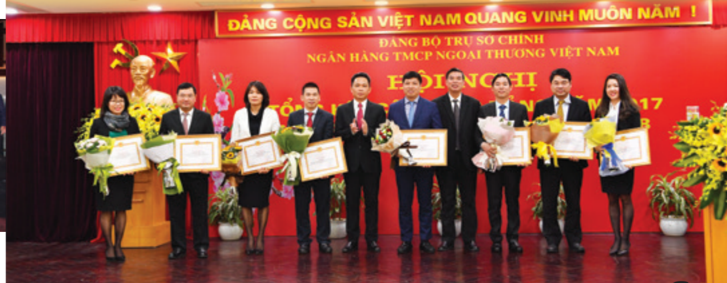
Đại diện cho 02 Chi bộ và 07 cá nhân trực thuộc Đảng bộ TSC Vietcombank nhận Giấy khen của Đảng ủy Vietcombank