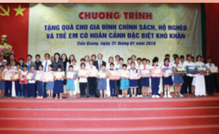
Bà Đặng Thị Ngọc Thịnh – Phó Chủ tịch nước Cộng hòa Xã hội Chủ nghĩa Việt Nam trao tặng quà cho trẻ em có hoàn cảnh đặc biệt khó khăn tại Tiền Giang