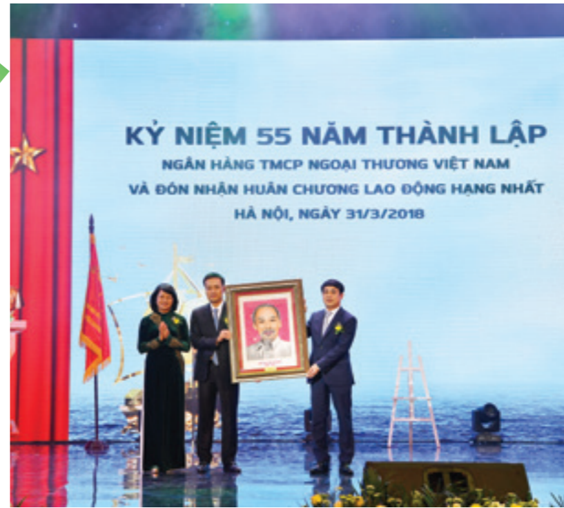
Đ/c Đặng Thị Ngọc Thịnh - Ủy viên Ban chấp hành TW Đảng, Phó Chủ tịch nước (ngoài cùng bên trái) tặng quà chúc mừng Vietcombank nhân kỷ niệm 55 năm thành lập