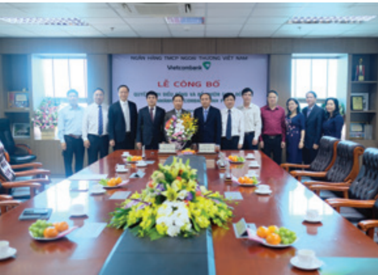
Lãnh đạo địa phương và lãnh đạo Vietcombank tặng hoa chúc mừng và chụp hình lưu niệm cùng tân Giám đốc Vietcombank Vĩnh Phúc