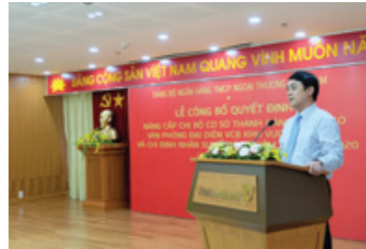
Đ/c Nghiêm Xuân Thành - Ủy viên BCH Đảng bộ Khối Doanh nghiệp TW, Bí thư Đảng ủy, Chủ tịch HĐQT Vietcombank phát biểu tại buổi lễ