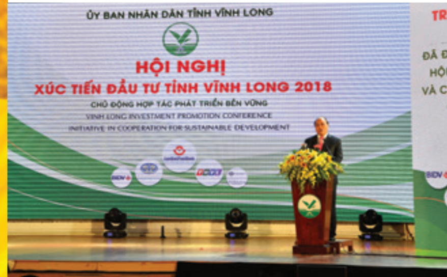
Thủ tướng Chính phủ Nguyễn Xuân Phúc phát biểu chỉ đạo tại Hội nghị