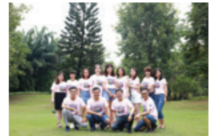
Kỷ niệm trong một lần đi dã ngoại với Phòng giao dịch Điện Biên - Vietcombank CN Tây Hồ