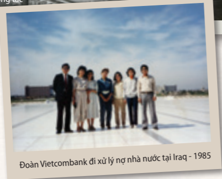
Đoàn Vietcombank đi xử lý nợ nhà nước tại Iraq - 1985

Vậy chúng ta đã làm gì trước khối tài sản lớn bị phong tỏa?