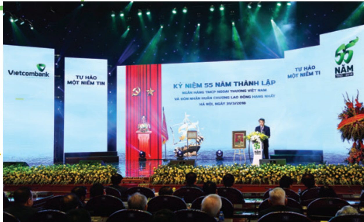
Đ/c Lê Minh Hưng - Ủy viên Ban chấp hành TW Đảng, Bí thư Ban Cán sự Đảng, Thống đốc NHNN Việt Nam phát biểu tại sự kiện