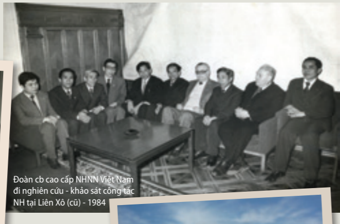
Đoàn cb cao cấp NHNN Việt Nam đi nghiên cứu - khảo sát công tác NH tại Liên Xô (cũ) - 1984