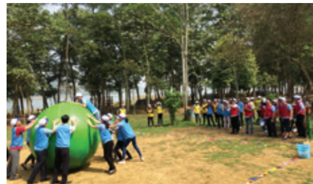
Các đội tham gia trò chơi