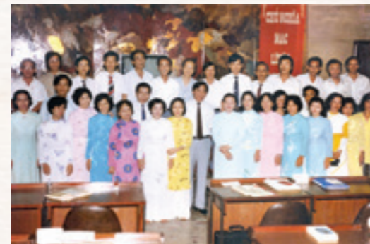
Hội nghị thanh toán QT Vietcombank - 1990

Có thể nói, sau gần 20 năm sóng gió, chính sách cấm vận của Mỹ đã phải chấm dứt. Toàn bộ số tiền ngoại tệ gửi tại Hoa Kỳ đã được giải tỏa. Và người viết bài này có dịp may được thay mặt Vietcombank, Việt Nam tiếp nhận toàn bộ số ngoại tệ do Mỹ đối với Việt Nam giải tỏa để nhập vào quỹ ngoại tệ của Nhà nước vào tháng 9/1995.