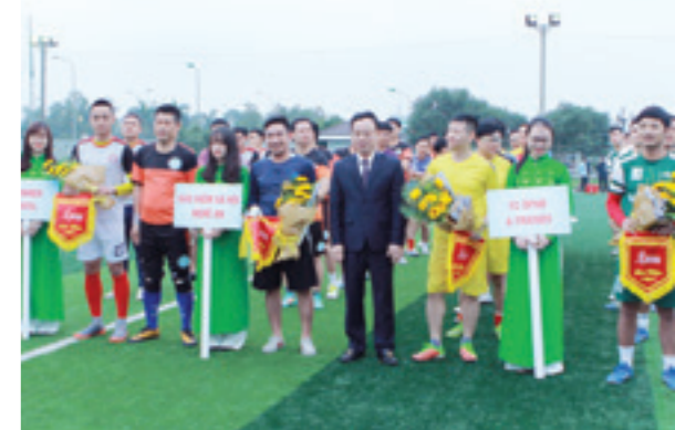
Lễ khai mạc giải đấu

Được biết, Trường Tiểu học Tri Lễ 4 có 44 thầy giáo đã được trao giải ấn tượng VTV năm 2017 ở hạng mục Nhân vật của năm. Trường có 29 lớp, dạy học tại 6 điểm trường giữa vùng cao biên giới (cách thị trấn Quế Phong 50km, có 17km đường biên tiếp giáp nước bạn Lào). Các học trò nơi đây đang phải học tập trong điều kiện rất khó khăn, nghèo khổ, thiếu thốn, thời tiết khắc nghiệt.