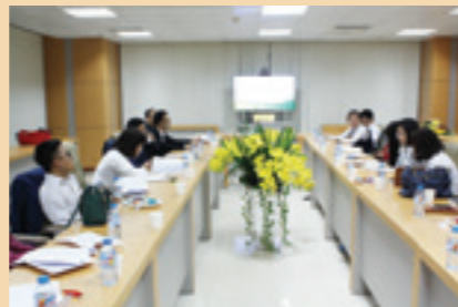
Vietcombank Hà Tây tổ chức tập huấn chính sách tài chính kế toán.

Định hướng trong tương lai, BCH Đoàn cơ sở sẽ phối hợp với các phòng ban để triển khai nhiều hoạt động tương tự, đóng góp nhiều hơn vào công tác chuyên môn.