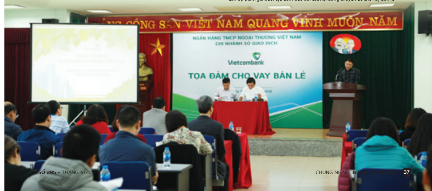
Cán bộ tham gia buổi tọa đàm trao đổi các nội dung chuyên đề cho vay bán lẻ

Kết thúc Tọa đàm, Giám đốc Sở giao dịch đã có những phát biểu mang tính định hướng và chỉ đạo các phòng/ban liên quan nhằm tháo gỡ các khó khăn, vướng mắc đang tồn tại trong hoạt động cho vay thể nhân tại Sở Giao dịch hiện nay. Đồng thời, phát động và yêu cầu toàn thể cán bộ bán lẻ Sở Giao dịch cần cố gắng và nỗ lực hơn nữa trong công tác khách hàng, nhanh nhạy và linh hoạt trong việc áp dụng các chính sách và cơ chế hoạt động kinh doanh để hoàn thành các chỉ tiêu kế hoạch tín dụng bán lẻ được giao năm 2018, góp phần đưa Sở giao dịch cùng toàn hệ thống Vietcombank đạt được mục tiêu trở thành ngân hàng bán lẻ số 1 Việt Nam.