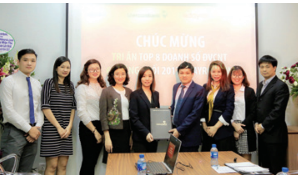
Đại diện Vietcombank, Adayroi.com và đại diện các cổng thanh toán chụp hình lưu niệm lại buổi lễ